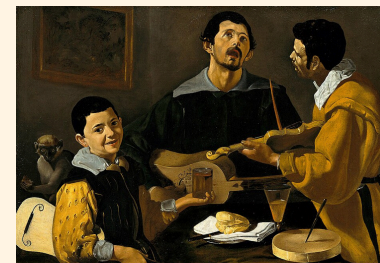
Musique vocale espagnole des XVI e et XVII e siècles